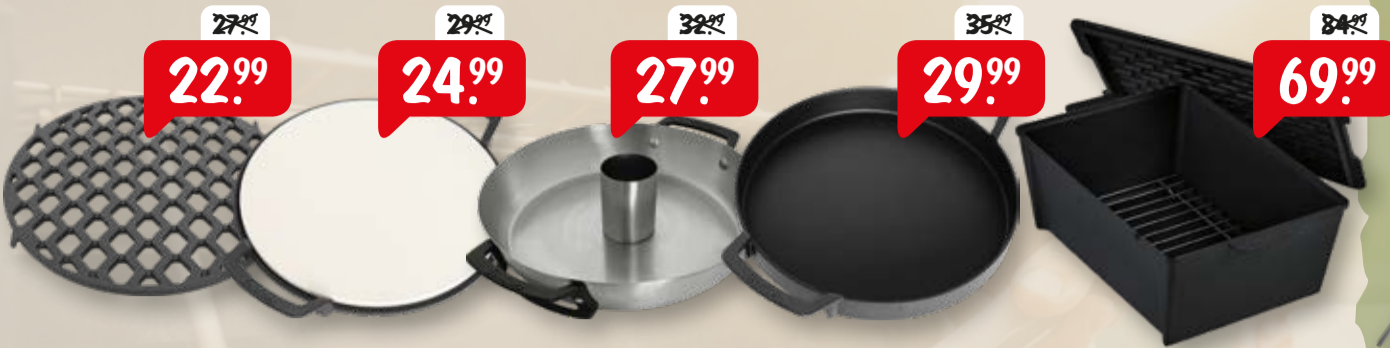
Enders Gussrost Enders Pizzastein Enders Geflügelbräter Enders Pfanne Enders Dutch Oven