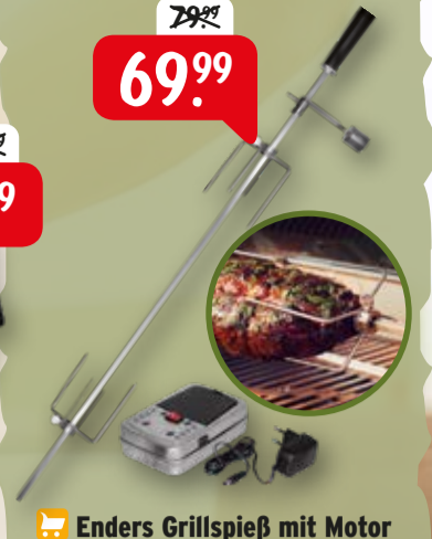
Enders Grillspieß mit Motor